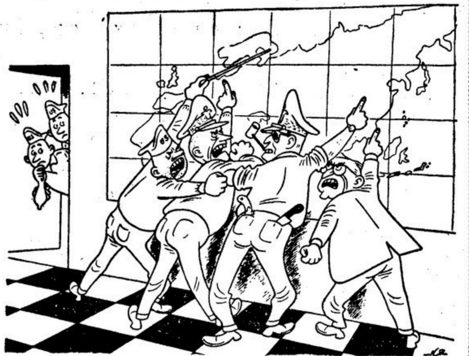
Они ссорятся из-за того, что не могут решить, какая очередная страна должна быть «напасть» на нас... (Рисунок худ. Вердини из итальянского журнала «Виз нуово».)